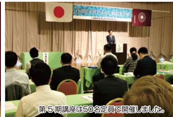
第5期講座は50名定員で開催しました。