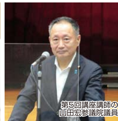
第5回講座講師の 山田宏参議院議員