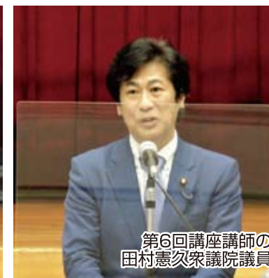
第6回講座講師の 田村憲久衆議院議員