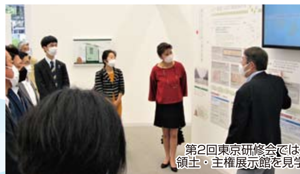
第2回東京研修会では、 領土・主権展示館を見学