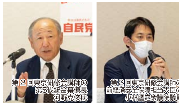
第2回東京研修会講師の 第5代統合幕僚長 河野克俊氏