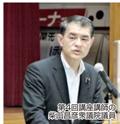
第4回講座講師の 柴山昌彦衆議院議員