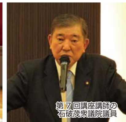
第7回講座講師の 石破茂衆議院議員