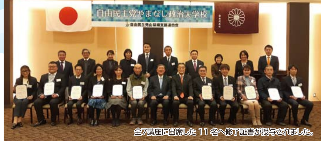
全7講座に出席した11名へ修了証書が授与されました。

かいてらす (地場産業センター) ※諸事情により変更する場合があります。 〒400-0807 山梨県甲府市東光寺3丁目13-25